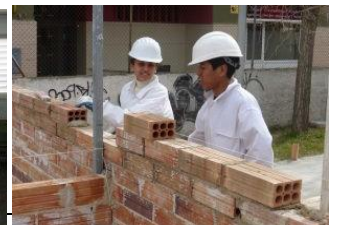
Pàgina 4 de 4